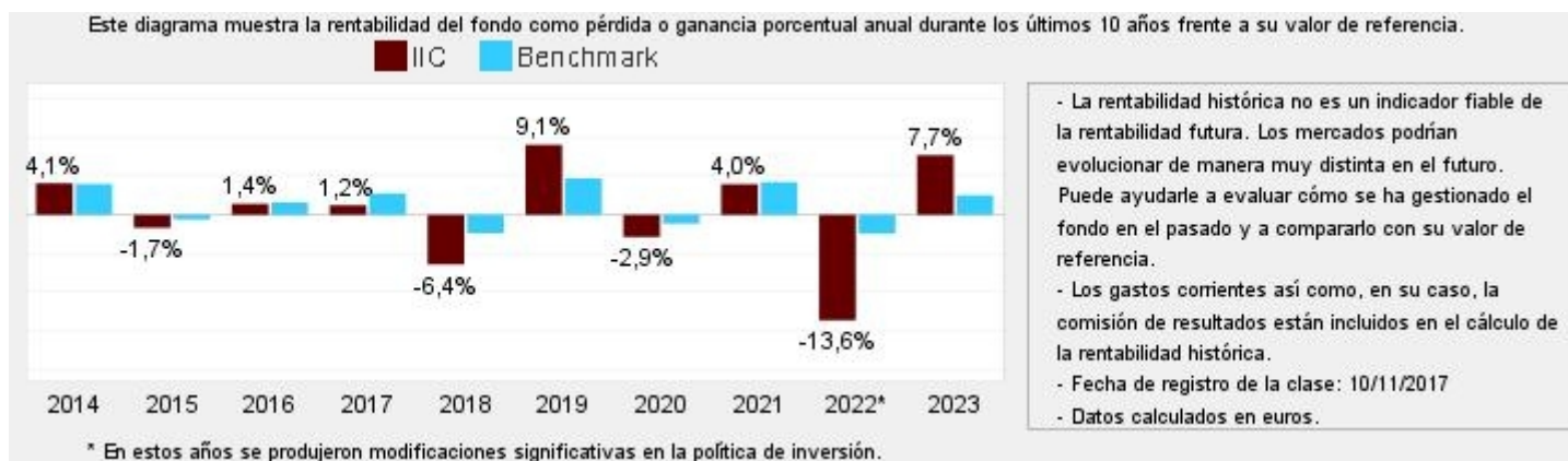
Gráfico rentabilidad histórica

Datos actualizados según el último informe anual disponible.