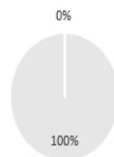
2. Ajuste a la taxonomía de las inversiones, excluidos los bonos soberanos*