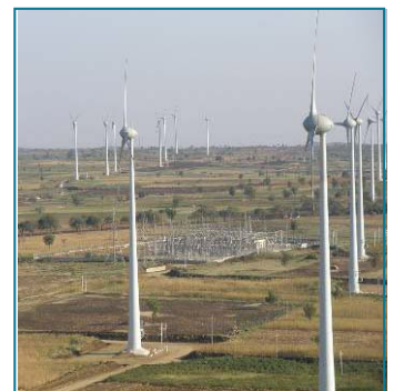
Parque de Gadag