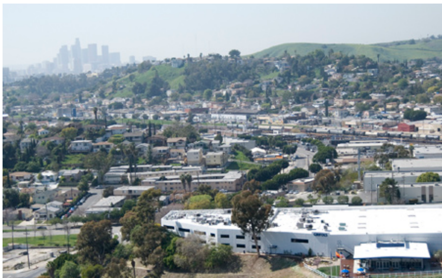
Vista aérea de la sede central de Grifols en Los Angeles.