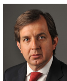
Área de Negocios Mayoristas de Energía D. Manuel Fernández