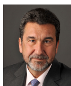
Área de Negocios Regulados de Gas D. Antoni Peris