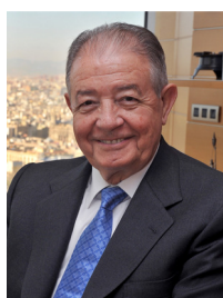
Presidente D. Salvador Gabarró

El equipo directivo del nuevo Grupo Gas Natural – Unión Fenosa está integrado por los siguientes miembros: