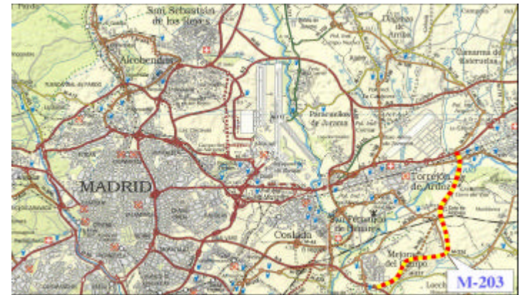
Localización de la futura M-203 (Madrid)