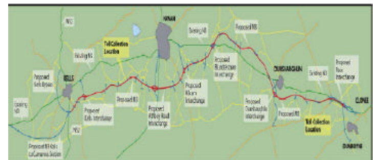
Proyecto de trazado de la M-3 (Irlanda)