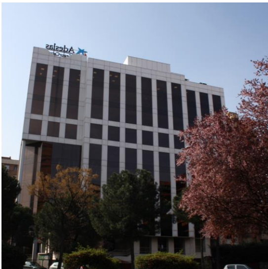
Fachada del Edificio

Esta nueva adquisición de la SOCIMI gestionada por Grupo Lar se une a la compra de los centros comerciales “Txingudi” en Irún y “Las Huertas” en Palencia el pasado mes de marzo y del edificio comercial ocupado por Media Markt en Villaverde, Madrid. Con ella el importe total invertido por Lar España asciende a 72,7 millones de euros, un 18% del capital captado en la salida a Bolsa. Se trata de una operación off-market y desembolsada totalmente con fondos de la compañía.