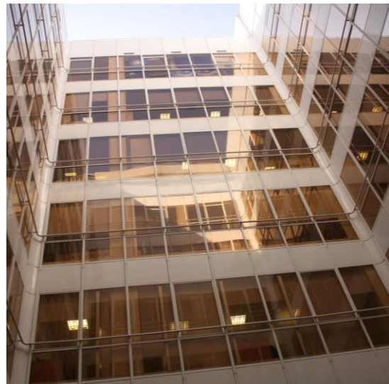
Interior del Edificio