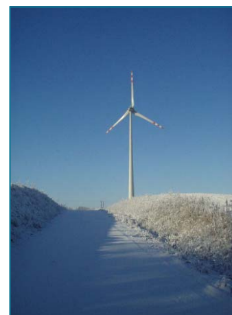
Fase I Kisielice