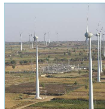
Parque de Gadag