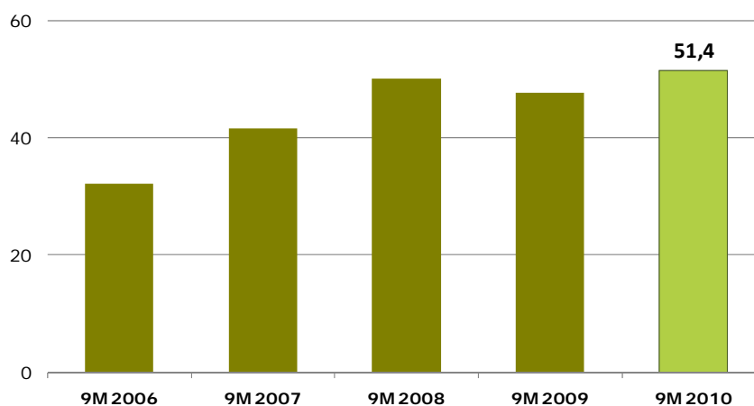
RESULTADOS DE EXPLOTACIÓN (EBIT) ACUMULADO NUEVE PRIMEROS MESES. HISTÓRICO DESDE 2006 En millones de euros

Así, el resultado de explotación, EBIT, se incrementa un 7,84% hasta 51,43 millones de euros, lo que representa un margen sobre las ventas de 16,22%.