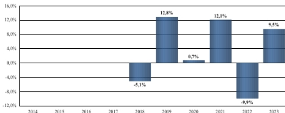
Rentabilidad de la IIC como pérdida o ganancia porcentual anual durante los últimos 10 años