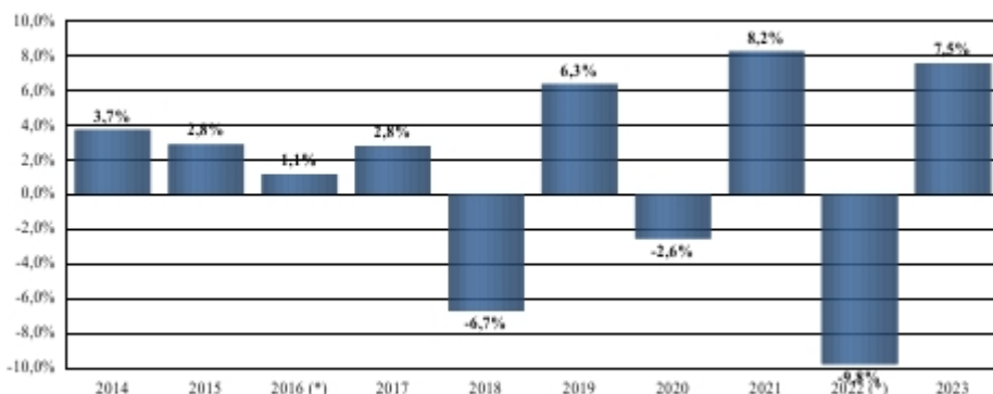
Rentabilidad de la IIC como pérdida o ganancia porcentual anual durante los últimos 10 años