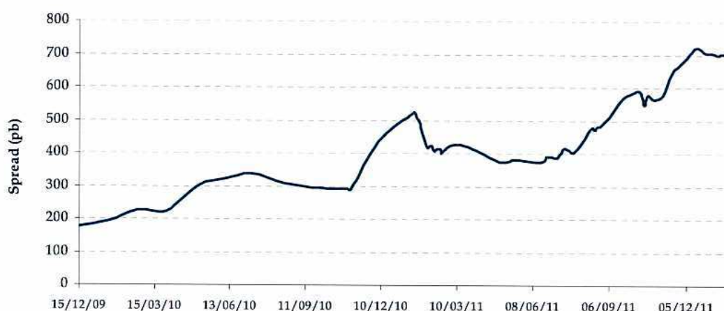
Gráfico 4. Evolución de la rentabilidad media de emisiones de deuda subordinada

Del gráfico anterior se puede observar que la rentabilidad promedio de la deuda subordinada ha seguido una senda de crecimiento constante desde finales de 2009 para estabilizarse en el segundo semestre de 2010. A finales de 2010 se produce un fuerte crecimiento registrándose los niveles máximos de rentabilidad exigida en mercado hasta entonces. A partir de entonces comienza una progresiva corrección a la baja durante el primer semestre de 2011. Dicha tendencia se invierte durante el segundo semestre de 2011, llegando a registrarse en el último mes los niveles máximos de rentabilidad exigida en mercado.