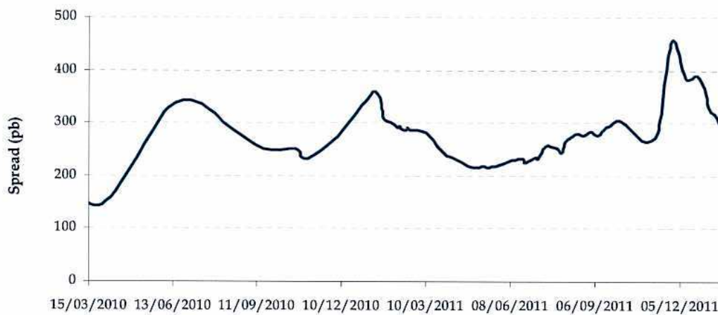
Gráfico 1. Evolución de la rentabilidad media de emisiones de deuda senior

Del gráfico anterior se desprende que hasta finales del primer semestre de 2010, la rentabilidad promedio de las emisiones de deuda senior experimentó una etapa de estrés relacionada con la incertidumbre financiera y contagiada por el "caso griego". A finales de junio 2010, se dio paso a una situación de mercado más relajada hasta comienzos de noviembre 2010 desde donde comienza otra etapa de estrés de rentabilidad en los mercados. Posteriormente, a partir del primer semestre de 2011 comienza una progresiva corrección a la baja. Dicha tendencia se invierte durante el segundo semestre de 2011, produciéndose el periodo de mayor subida y estrés en el mercado el pasado noviembre de 2011, donde se alcanzan los niveles máximos históricos. Desde entonces y hasta la actualidad se ha producido una fuerte recuperación volviendo a niveles cercanos a los existentes en septiembre 2011.