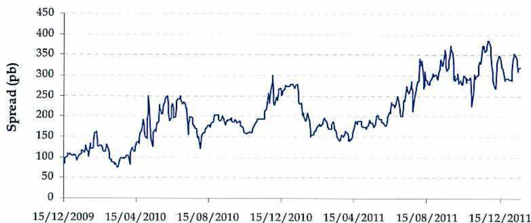
Gráfico 5. Evolución CDS Senior 5 años del Reino de España