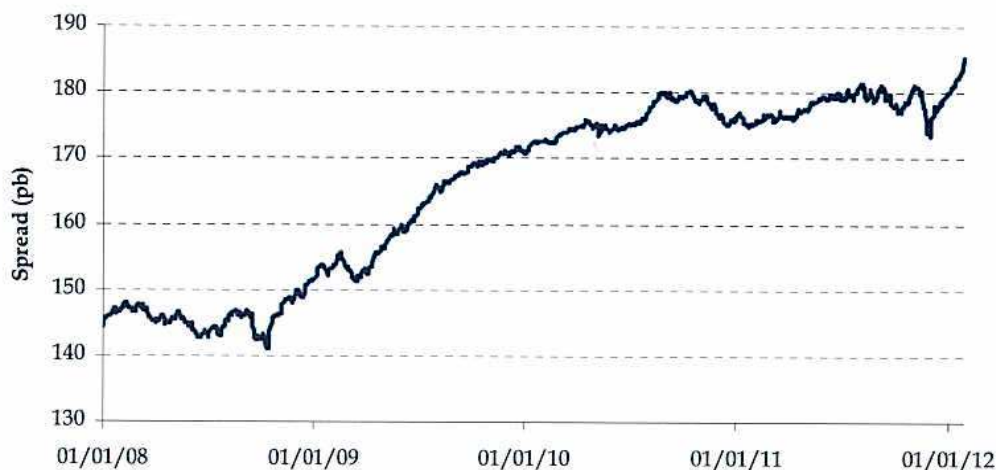
Gráfico 3. Índice de rentabilidad IBOXX

Como se puede observar en el gráfico superior, el índice IBOXX ha experimentado una tendencia al alza desde finales de 2008 hasta el último trimestre de 2010. Desde entonces hasta la fecha del presente informe, esta tendencia ha ido suavizándose y los valores del índice se han estabilizado en niveles entre los 170 y 185 pb. A fecha 26 de enero de 2012, el nivel del IBOXX se encuentra en 184 pb.