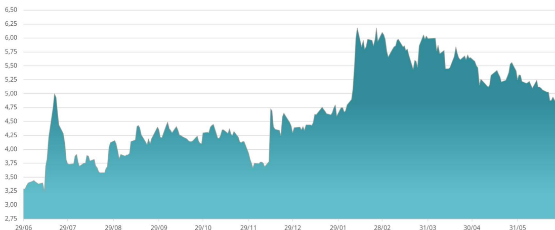
Evolución Acción RJF Jul'20 – Jun'21

Con fecha 29 de abril de 2021, la Junta General Ordinaria y Extraordinaria de Accionistas, aprobó el plan denominado "Dividendo Flexible Reig Jofre", para lo cual se acordó un aumento de capital con cargo a reservas, concediéndose a las acciones en circulación un derecho de asignación gratuita, y un compromiso de recompra de esos derechos por parte de la propia sociedad.