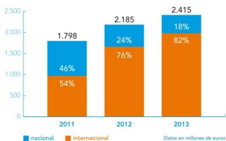
Cartera de pedidos

Al cierre de 2013, la cartera de contratos pendiente de ejecutar se elevaba a 2.415 millones de euros , frente a los 2.185 millones con que finalizó 2012. Ello representa un avance de 230 millones de euros (+ 11% ). Por mercados, la cartera creció el 18% en el exterior , situándose en 1.969 millones de euros, lo que equivale al 82% del total. En el nacional, en cambio, se experimentó una caída del 15%, hasta quedar situada en 446 millones.