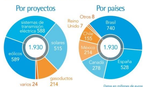
Recursos movilizados 2011-2013

Elecnor abarca dos grandes negocios: por un lado, la ejecución de obras y proyectos, apoyado en la capacidad del Grupo de promover, construir, mantener y operar todo tipo de infraestructuras ; por otro, el negocio patrimonial de promoción e inversión en energías renovables y concesiones de infraestructuras de energía y medio ambiente, actividades todas ellas que le han llevado a movilizar recursos de inversión por valor de 1.930 millones de euros en los últimos 3 años.