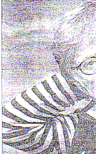
Robert Redford será el encargado de intervención en la que se hablará de

Y es que el impacto de la operación no se ha restringido al mundo de Internet. El sistema operativo Windows Mobile de Microsoft tiene una cuota del 9% en dispositivos móviles, mientras que Google está desarrollando una plataforma abierta, denominada Android, que podría restarle mercado. Mientras, Yahoo tiene una presencia muy importante en el mundo de las aplicaciones para el móvil, que se vio reforzada recientemente con su Yahoo Go! De hecho, algunos analistas han llegado a sugerir que Nokia debería presentar una contraoferta con Yahoo para mejorar su presencia en el mundo de los contenidos También será la comidilla de estos cuatro días el anuncio de Motorola de que estu-