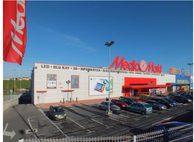
Fachada principal y aparcamiento de Nuevo Alisal