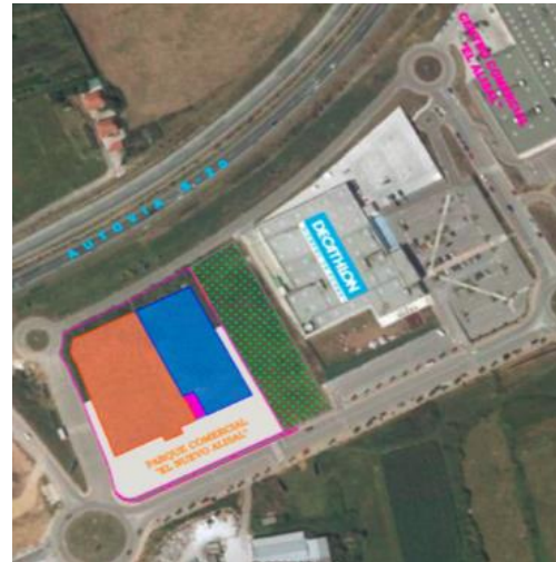
Vistas aéreas de la localización del parque comercial Nuevo Alisal