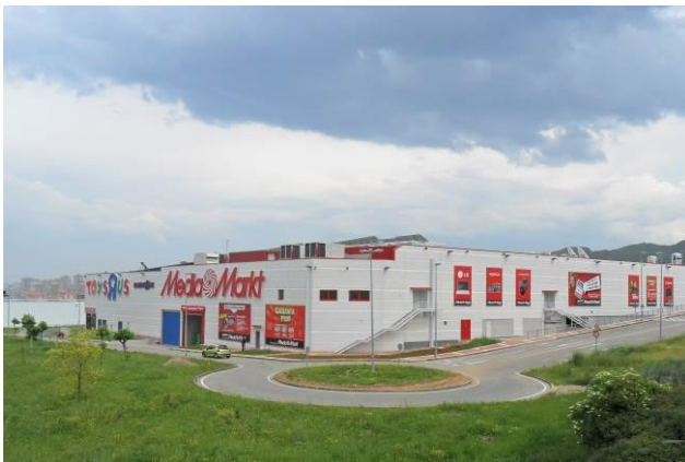
Perspectiva del activo adquirido por LRE