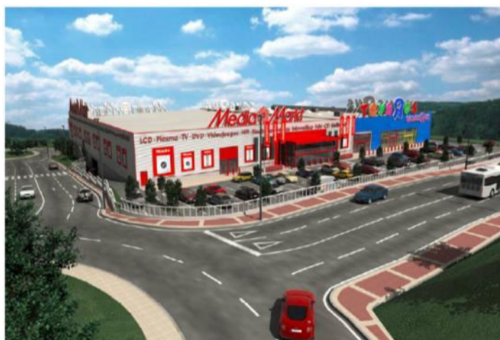
Fachada del parque comercial Nuevo Alisal adquirido por LRE

El parque comercial, construido en diciembre de 2010 y, hasta la fecha, propiedad del desarrollador local Grupo Sadisa, está situado a 3 kilómetros al oeste de Santander y cuenta con una superficie bruta alquilable (SBA) de aproximadamente 7.648 m 2 , distribuidos en 2 plantas, así como con 340 plazas de aparcamiento.