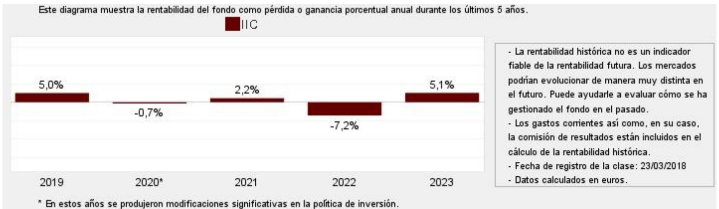
Gráfico rentabilidad histórica

Datos actualizados según el último informe anual disponible.