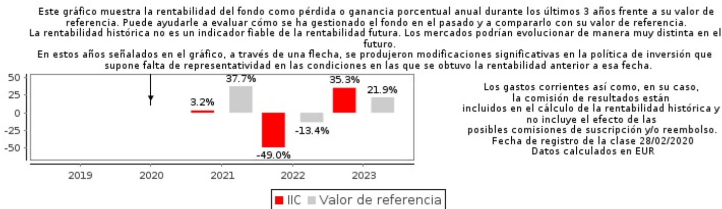
Gráfico rentabilidad histórica

Datos actualizados según el último informe anual disponible.