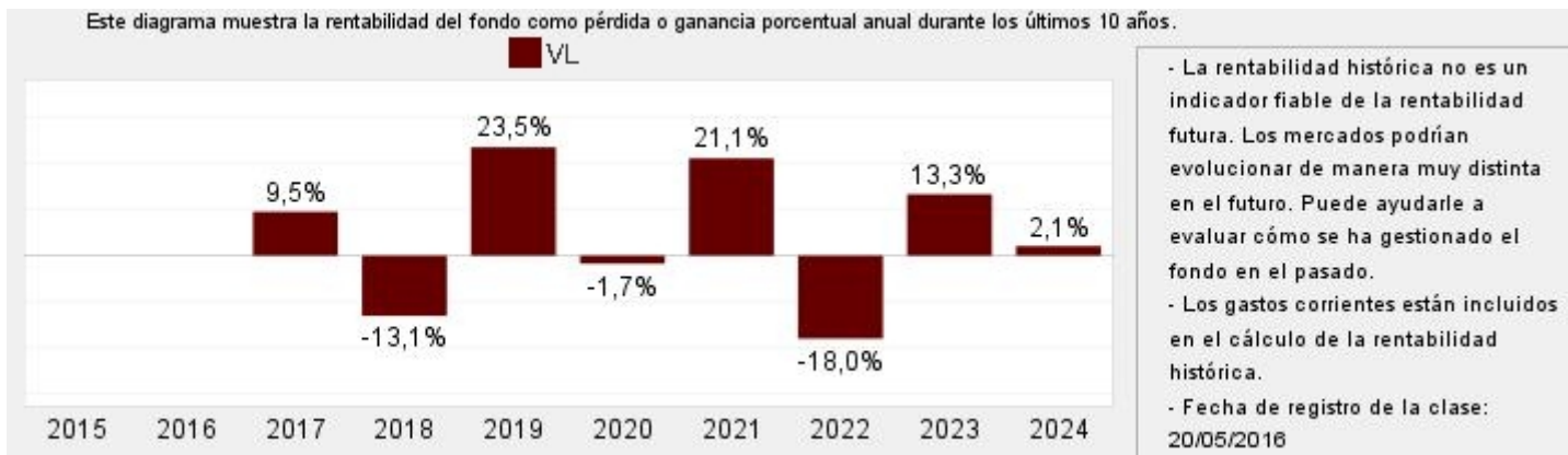
Gráfico rentabilidad histórica

Datos actualizados según el último informe anual disponible.