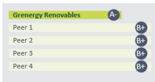
Tabla: Puntuación ISS ESG obtenida por Greenergy en 2022 en comparación a sus peers

Greenergy amplió su cobertura en otros ratings destacando ISS ESG y Refinitiv. En primer lugar, ISS ESG clasificó a Greenergy en primera posición dentro del sector de la electricidad renovable, con una puntuación de A1 y destacándola con un "nivel de transparencia muy alto". En cuanto al índice ESG Refinitiv, Greenergy obtuvo una puntuación de 81/100 posicionándose como 2º de un total de 79 empresas del sector de energías renovables presentadas al índice.