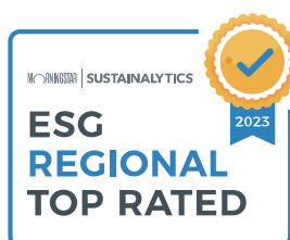
Tabla: Distinciones otorgadas a Greenergy por su liderazgo en gestión de riesgos ESG