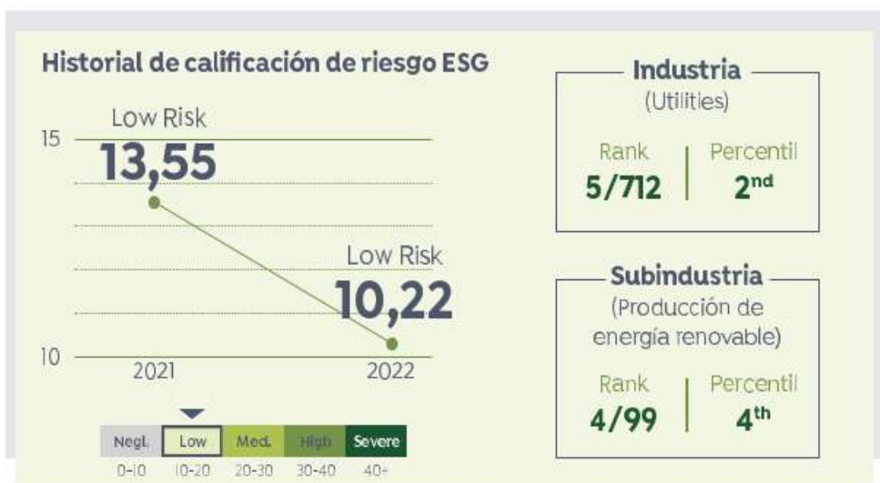
Tabla: Comparativa de resultados de Greenergy otorgada por Sustainalytics en 2022