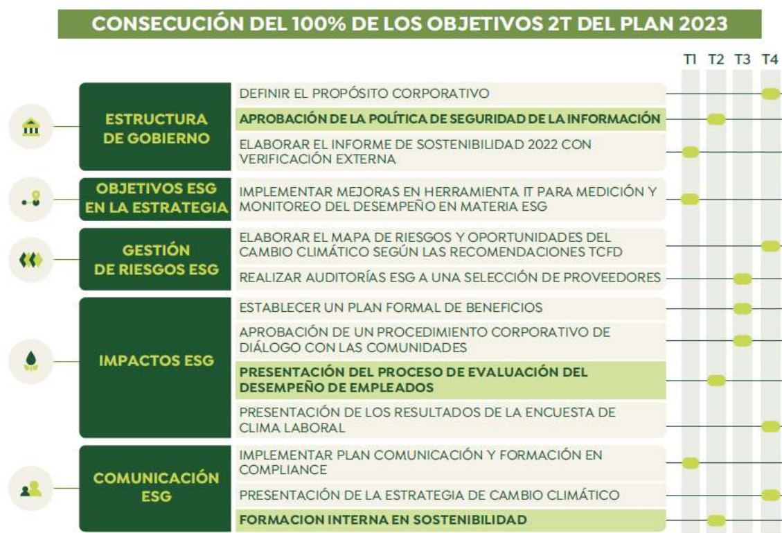
Tabla: Progreso del Plan de Acción ESG 2023

Finalmente, a final del ejercicio, se publicará la actualización de la estrategia ESG “ESG Roadmap 2024-2026” de los próximos 3 años.