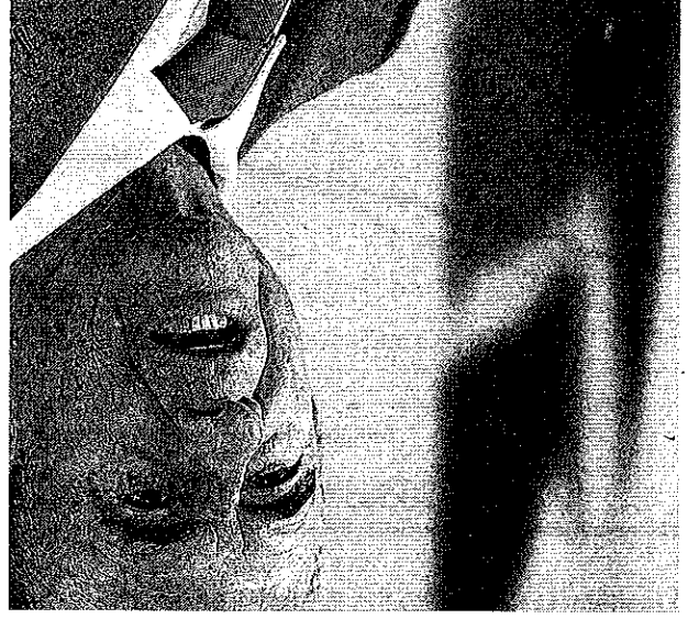
Emilio Botín, presidente de Grupo Santander.

La inspección en Santander tiene su matiz. "Las firmas que han aguantado la crisis que-Barclays de su estrategia de