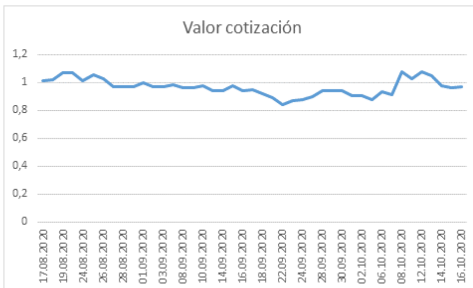
Este gráfico cubre el periodo de cotización de las acciones de GAM desde el 17 de agosto de 2020 hasta el 16 de octubre de 2020.

En los últimos meses, la acción de GAM ha cotizado por debajo de su valor nominal o ligeramente por encima, tal y como se muestra en el gráfico que se incluye a continuación.