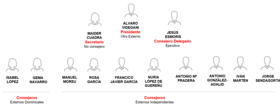
Nueva composición del Consejo de Administración