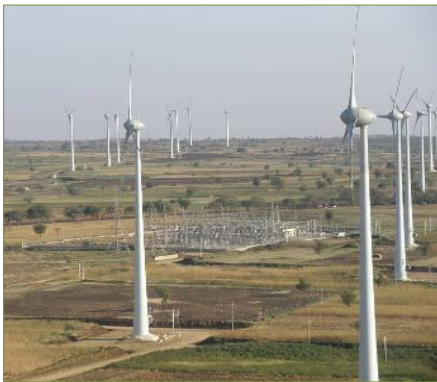
Parque de Gadag