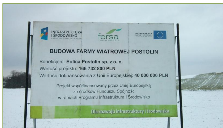
Inicio de construcción de Postolin (Polonia)