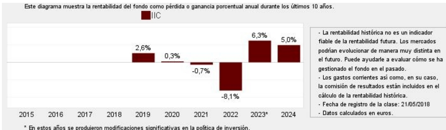
Gráfico rentabilidad histórica

Datos actualizados según el último informe anual disponible.