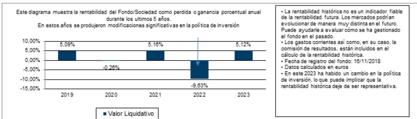
Gráfico rentabilidad histórica

Datos actualizados según el último informe anual disponible.