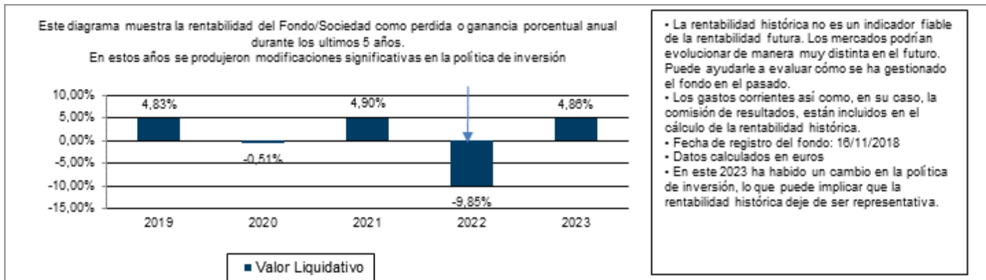
Gráfico rentabilidad histórica

Datos actualizados según el último informe anual disponible.