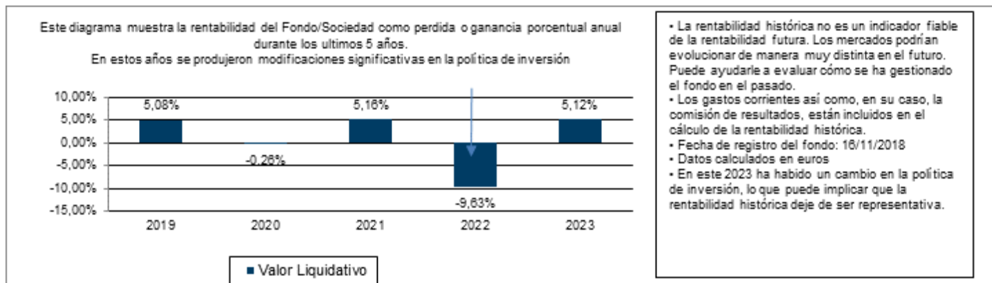
Gráfico rentabilidad histórica

Datos actualizados según el último informe anual disponible.