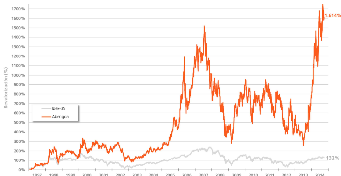
Evolución de la Capitalización de Abengoa en Bolsa (comparado con Ibex-35)