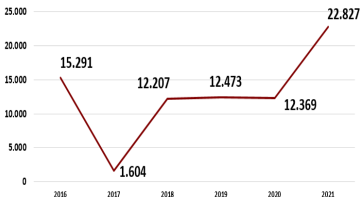
Evolución Deuda financiera neta

En el año 2021 la deuda financiera neta es de 22,8 millones de euros, lo que supone un incremento de un 85% respecto del año anterior motivado por la compraventa de la sociedad Inmobiliaria Meridional Gallega y, en menor importancia, por un incremento de la financiación de las promociones.