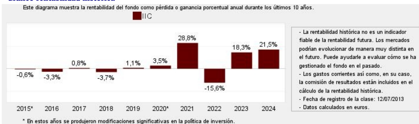
Gráfico rentabilidad histórica

Datos actualizados según el último informe anual disponible.