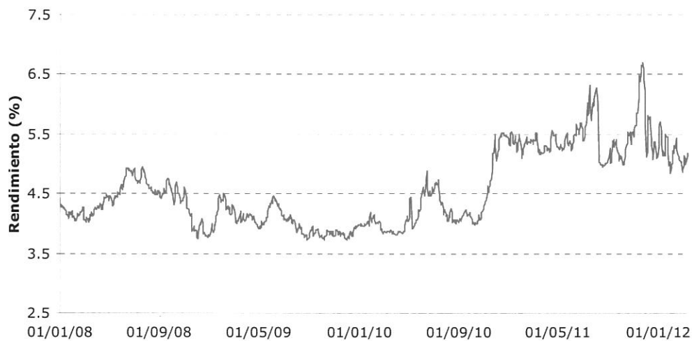
Gráfico 3. Benchmark - Evolución de la rentabilidad de la deuda española (GSPG10YR Index)

Como se puede observar en el gráfico anterior, la rentabilidad de la deuda española ha experimentado un periodo de cierta estabilidad comprendido entre enero de 2008 y enero de 2010. Aunque se observan ligeras fluctuaciones en la rentabilidad, éstas siempre se corrigen, volviendo a niveles de rentabilidad similares a los de partida. No obstante, desde finales del primer semestre de 2010 hemos asistido a un escenario de estrés de la deuda española que llevó a que se registrasen máximos de rentabilidad, superando el 6.30% a mediados de julio de 2011. Desde entonces, dicha tendencia se relajó hasta septiembre de 2011, fecha a partir de la cual da comienzo una breve etapa de estrés en los mercados, que desde entonces se ha ido suavizando hasta llegar a niveles ligeramente inferiores a los de principios de 2011.