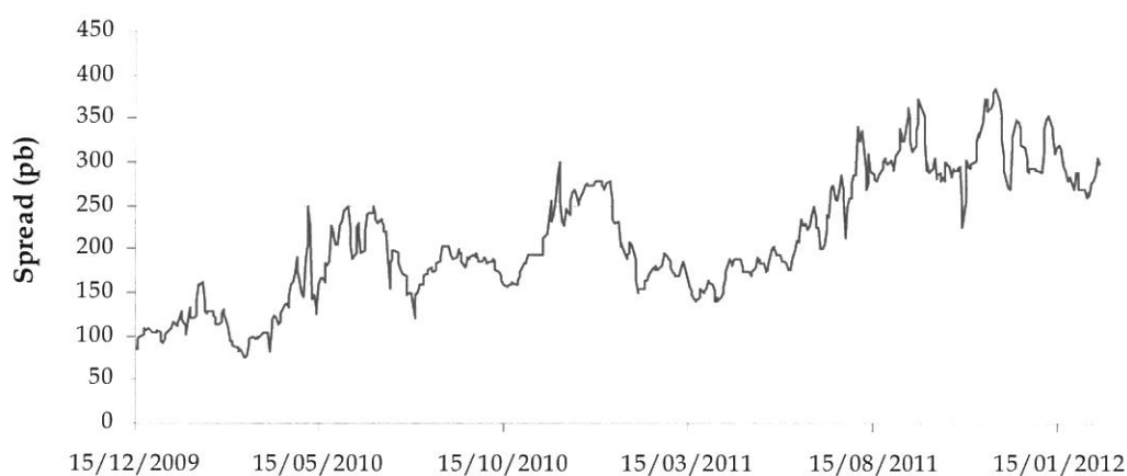
Gráfico 4. CDS Senior 5Y Reino de España

El nivel del CDS Senior 5Y del Reino de España a fecha 12 de marzo de 2012 se encuentra en 312 pb habiendo experimentado gran volatilidad desde comienzos del presente año y habiendo alcanzado un máximo histórico de 384 pb el 24 de noviembre de 2011.