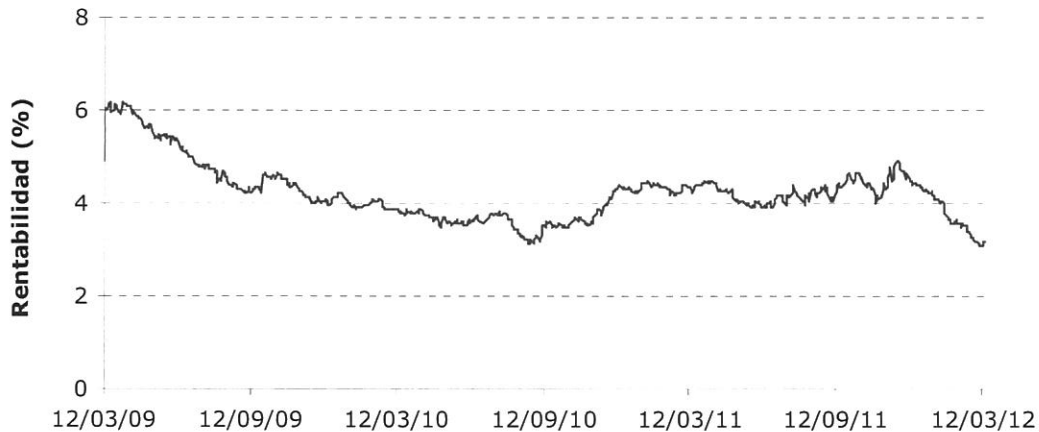
Gráfico 2. Evolución de la rentabilidad de la deuda senior del sector infraestructuras europeo

Del gráfico anterior se desprende que la rentabilidad promedio de las emisiones descendió notablemente durante el año 2009, estabilizándose en rentabilidades en torno al 4% hasta finales de 2011, fecha a partir de la cual comenzó otro periodo de relajación en los mercados.