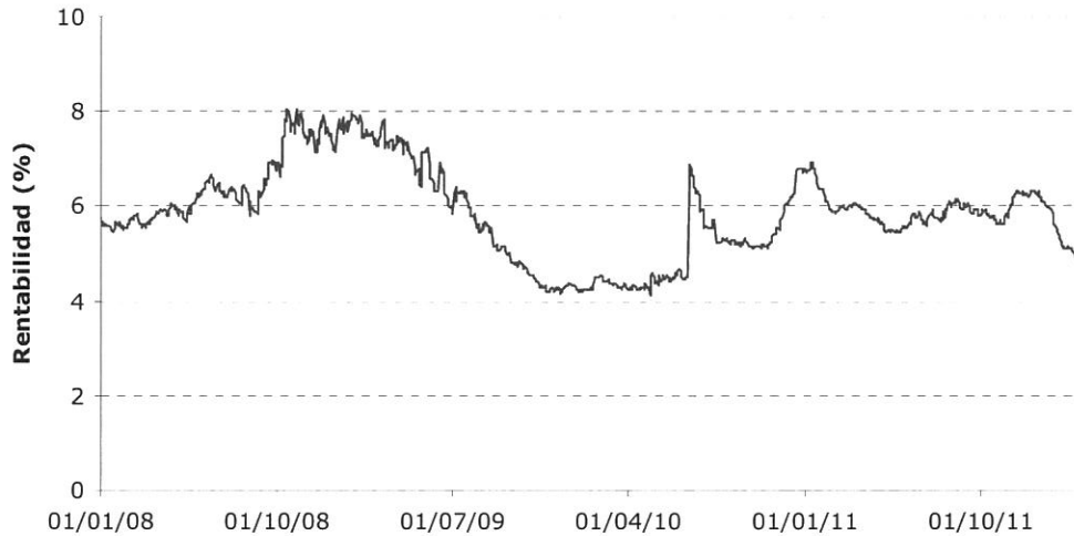
Gráfico 1. Evolución de la rentabilidad de la deuda senior del sector infraestructuras español

Del gráfico anterior se desprende que la rentabilidad de las emisiones ha fluctuado notablemente desde el año 2008, en línea con las oscilaciones de mercado.