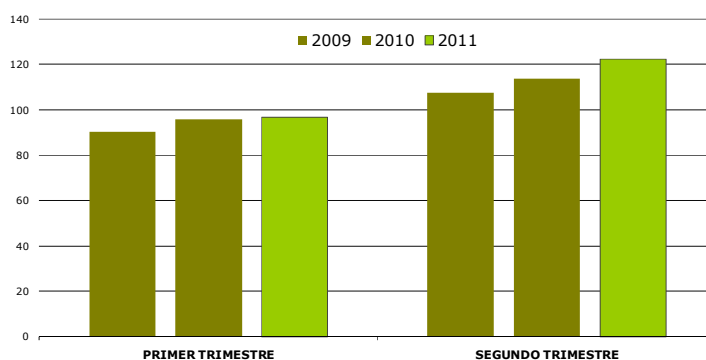
CIFRA DE VENTAS HISTÓRICO TRIMESTRAL DESDE 2009 En millones de euros

La demanda de envases de vidrio en dichas áreas, se mantiene en moderada tendencia de reactivación, reflejo de las condiciones de consumo de los productos de alimentación y bebidas.