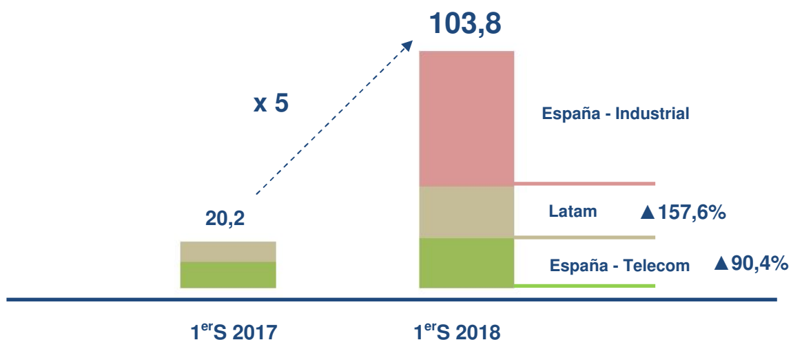
Detalle Cartera Proyectos Continuados (Millones euros)

La cifra de cartera de proyectos citada se comenzará a ejecutar en los próximos meses lo que consolida el cumplimiento de los objetivos marcados para el ejercicio 2018 en el Plan Estratégico.