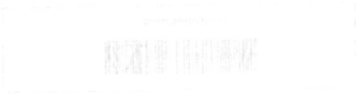
Foto Acreditación de inscripción de escritura de 2021/1614 de fecha 28/06/2021. El registro de inscripción de escritura de 2021/1614 de fecha 28/06/2021. El registro de inscripción de escritura de 2021/1614 de fecha 28/06/2021.

El presente documento es una copia de la inscripción de escritura de 2021/1614 de fecha 28/06/2021. El registro de inscripción de escritura de 2021/1614 de fecha 28/06/2021. El registro de inscripción de escritura de 2021/1614 de fecha 28/06/2021.