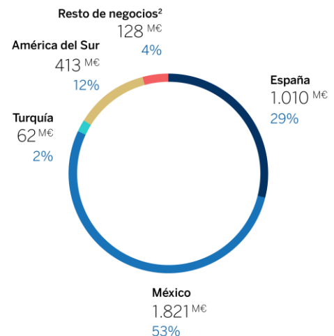
Resultado atribuido recurrente Grupo BBVA Por áreas de negocio 6M 2022 (1)

El Grupo BBVA generó un resultado atribuido de 3.001 millones de euros en el primer semestre de 2022, lo que supone un crecimiento interanual del 59,3%. Excluyendo el impacto neto de -201 millones de euros por la compra de oficinas en España a Merlin, el beneficio recurrente ascendió a 3.203 millones de euros, un 40,8% más. En el segundo trimestre del ejercicio, el beneficio ascendió a 1.675 millones de euros.