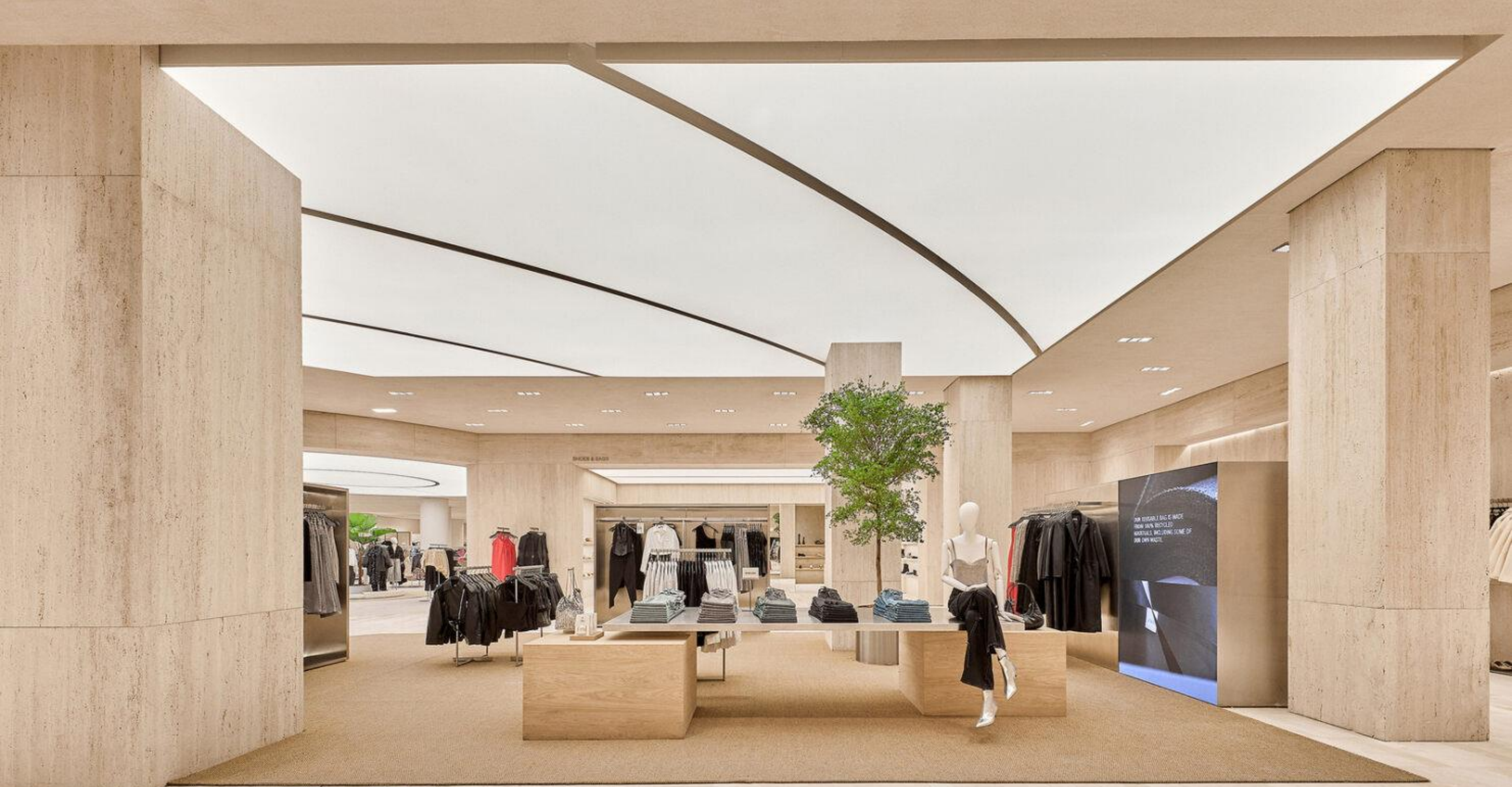
Nuevo diseño de tienda Zara: Dubai Mall of the Emirates