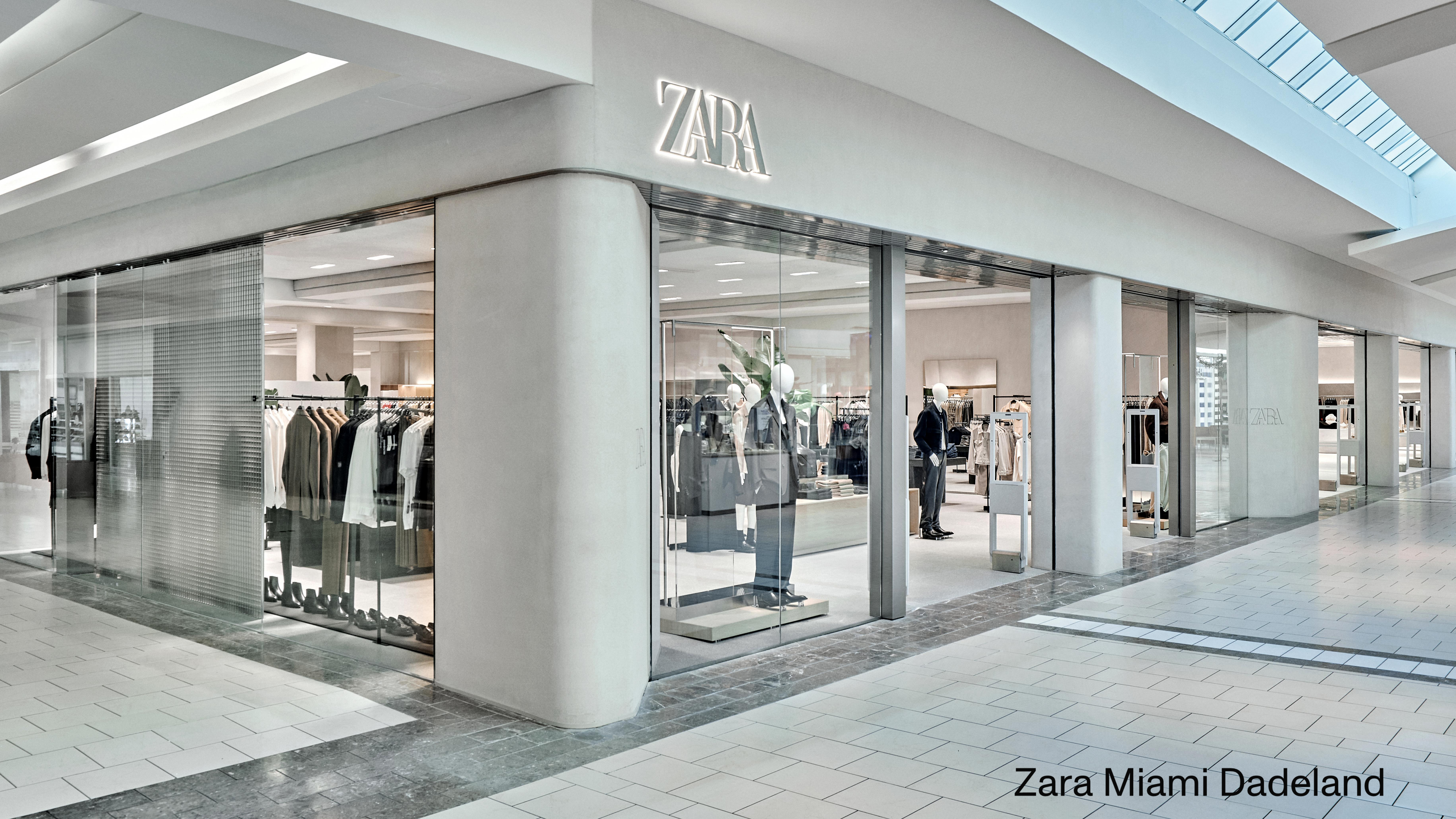
Zara Miami Dadeland