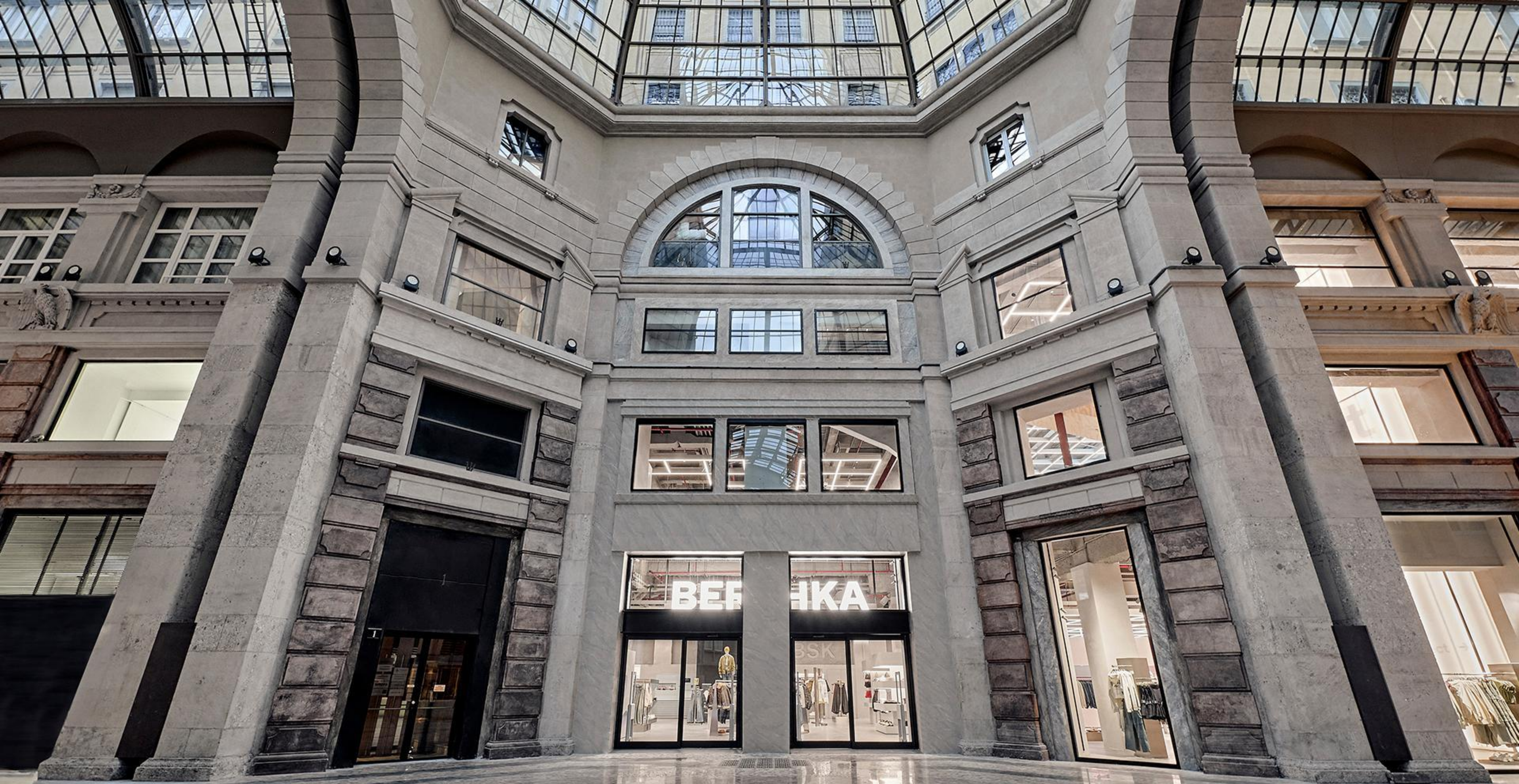
Bershka Milano Corso Vittorio Emanuele