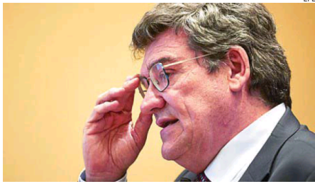
José Luis Escrivá, ministro de Seguridad Social