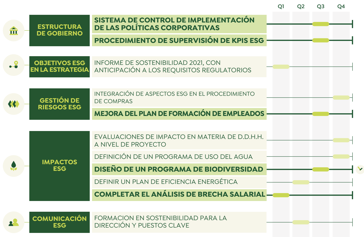
Tabla 6.1 Progreso del Plan de Acción ESG 2022 en Q3

Así, en el presente informe, la Compañía informa sobre las acciones llevadas a cabo para cumplir con los objetivos programados para el tercer trimestre del año: la aprobación de un sistema de control de implementación de las políticas, la definición de un procedimiento de supervisión interna de KPIs de ESG, y la mejora de su plan de formación a empleados, así como el objetivo pendiente del primer trimestre de completar el análisis de brecha salarial. El diseño del programa de biodiversidad queda por ahora pendiente de cumplimiento.